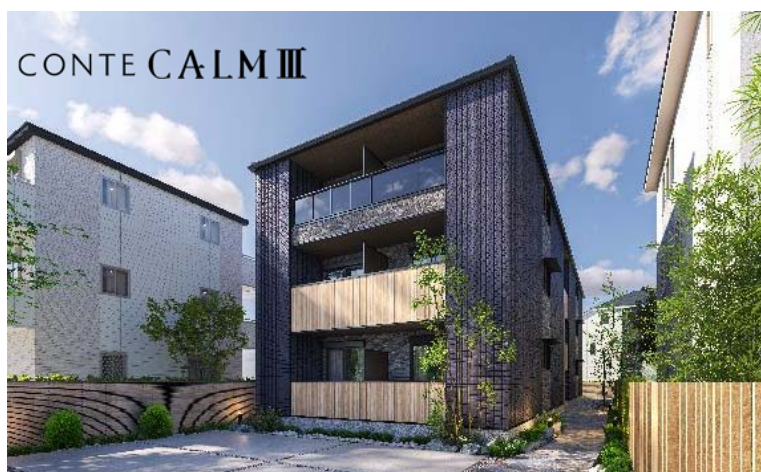
コンテ カルムⅢ(1 棟 12 戸北入) 外観イメージ