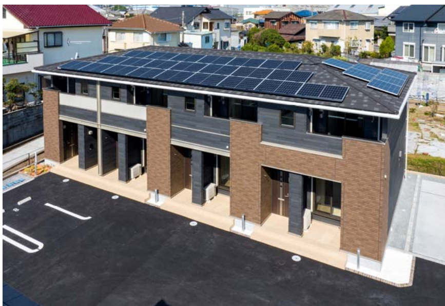
CO2 排出量を削減する大東建託の ZEH 賃貸住宅

当社は今後も ZEH 賃貸住宅などの環境配慮型賃貸住宅の提案・販売を通して、脱炭素住宅の供給をさらに加速し、RE100 の達成を目指します。