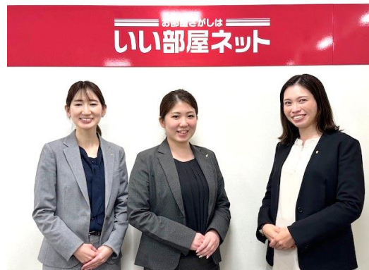
店舗スタッフ集合写真