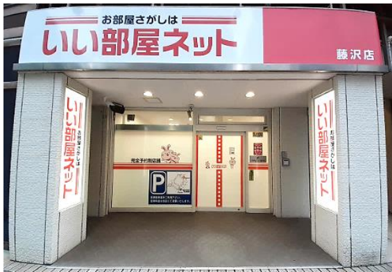
「いい部屋ネット藤沢店」外観

同社は今後も、新しい勤務形態を積極的に導入し、人材確保および従業員定着率の向上を目指していきます。