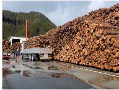
朝来バイオマス発電所 貯木場