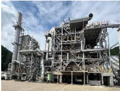
朝来バイオマス発電所 ポイラー