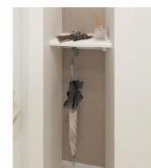
8 気配りカウンター