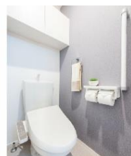
3 トイレ収納・備品