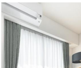
2 カーテンボックス