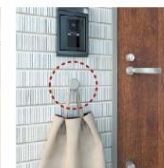
7 チョイ掛けフック