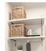
6 洗濯機上部可動棚