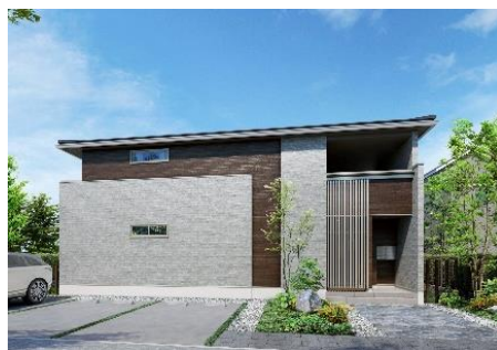
外観イメージ (左)北側玄関/5戸並び (右)妻側玄関/4戸並び