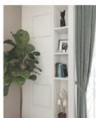
5 ディスプレイシェルフ