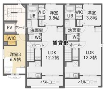
2F／オーナー宅＋賃貸間取りプラン(例)