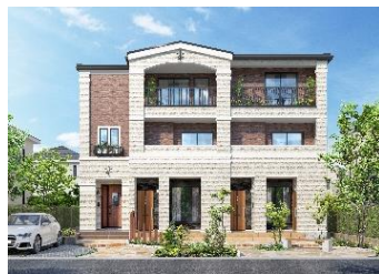
ユーロクラシック/南側玄関/3戸並び