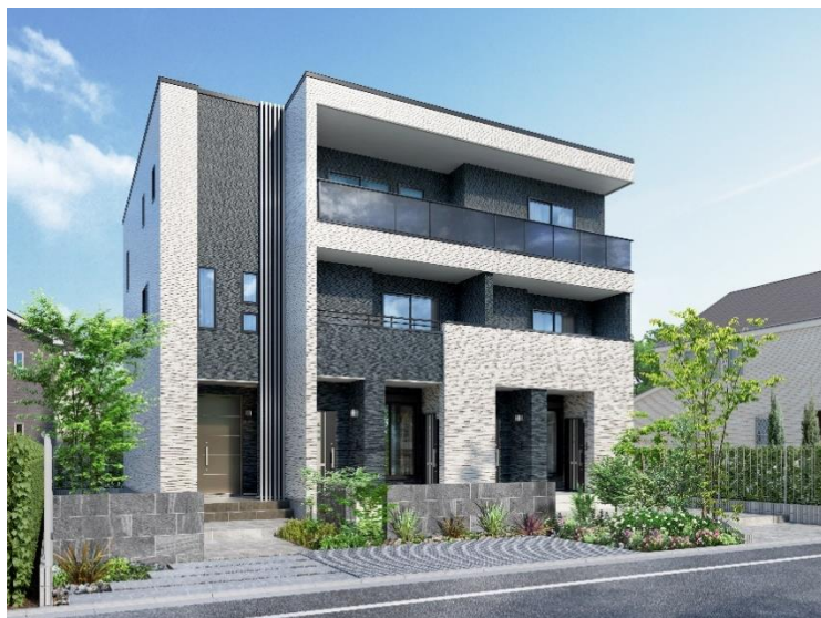
街並みに映える個性的な3つの外観デザインを用意...シンプルモダン/南側玄関/3戸並び

本商品は、当社の高付加価値賃貸住宅「CIEL(シエル)」シリーズの新商品です。都市部における自宅の建築や建て替えを検討する方へ、自宅を収益化する賃貸併用住宅商品として開発。さまざまな敷地条件や施主様の要望に柔軟に対応できる「セミオーダー式」を採用しています。収益を生み出す賃貸部分の面積比率を最大限確保し、レントラブル比の高い住戸設計プランを組み合わせることで、都市部における戸建て住宅建築検討者様へ長期にわたる安定した賃貸事業提案によるゆとりある暮らしの実現を提案していきます。