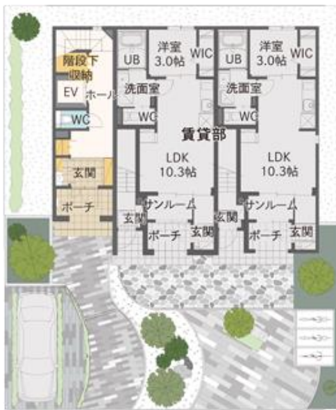
1F／オーナー宅＋賃貸間取りプラン(例)