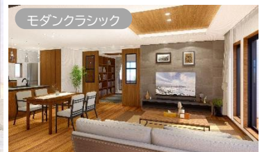
リビングは折上げ天井に変更し、開放感のある空間にアレンジ可能