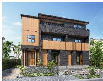
ジャパニーズモダン/南側玄関/3戸並び