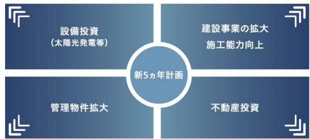
統合報告書2022 今後の投資方針(P44)

「統合報告書2022」では、中期経営計画「新5ヵ年計画」を財務・非財務の両面から解説することに注力しました。当社グループが目指す「事業ポートフォリオの転換(P.35)」では、当社グループの持続的な価値創造活動(P.11~P.44)によって、各事業の売上・利益やその比率がどう変わるのかについて解説しています。また、「新5ヵ年計画」と「目指す事業ポートフォリオ」の達成に向けた「今後の投資方針(P.44)」では、当社グループの事業領域拡大に向けた投資方針や資金投入について言及するなど、当社グループの非財務活動と財務成果の結びつきをより深く示す構成としています。