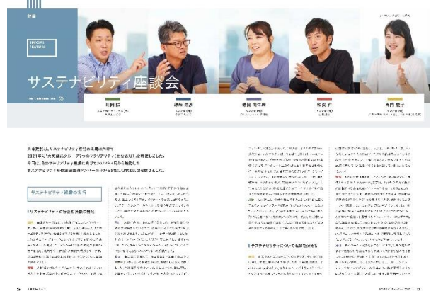
サステナビリティレポート2022 サステナビリティ座談会(P7~10) ※内容やレイアウトは変更となる場合があります

当社グループは、10月31日、当社グループのESG情報の適切な開示と、サステナビリティ経営に懸ける思いとその現状を広くステークホルダーのみなさまにご理解いただくことを目的として、当社グループ初となる「サステナビリティレポート2022」を創刊します。「サステナビリティレポート2022」では、事業を通じたサステナビリティ対応の推進を目的として本年新設された「サステナビリティ執行企画会議」のメンバーが、事業とサステナビリティについての意見交換をする特集記事「サステナビリティ座談会(P.7~10)」など、統合報告書だけでは言及できなかった、当社グループの「サステナビリティ経営の推進」に向けた思いや取り組みを詳細に解説しています。