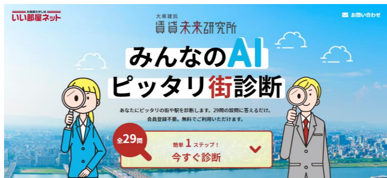
「みんなのAI ピッタリ街診断」トップイメージ

≫みんなのAI ピッタリ街診断( https://www.kentaku.co.jp/pittarinomachi/ )