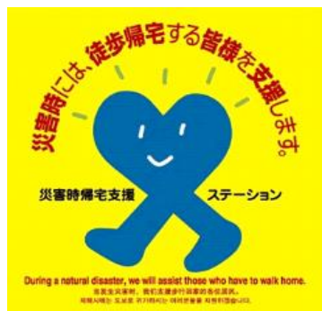
住民への啓発、認知度の向上を図る 災害時帰宅支援ステーションステッカー

今回、介護事業所としては初めての協定締結となり、本協定の締結事業者は計26事業者、協力店舗数は12,256カ所となります。