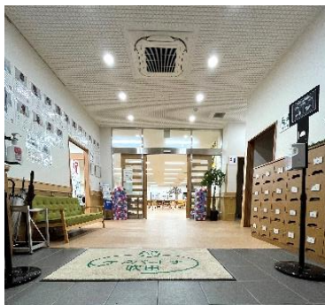
災害時帰宅支援ステーションとなったケアパートナー吹田 /大阪府吹田市(左:エントランスホール、右:多目的トイレ)