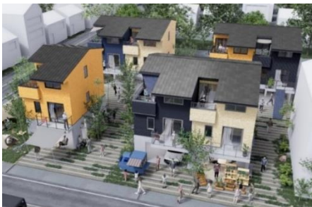
「ぼ・く・ラボ賃貸niimo(ニーモ)」外観イメージ