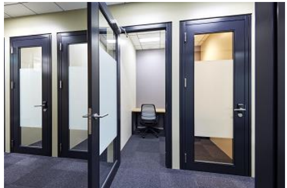
JustCo Zone 蒲田 プライベートスイート