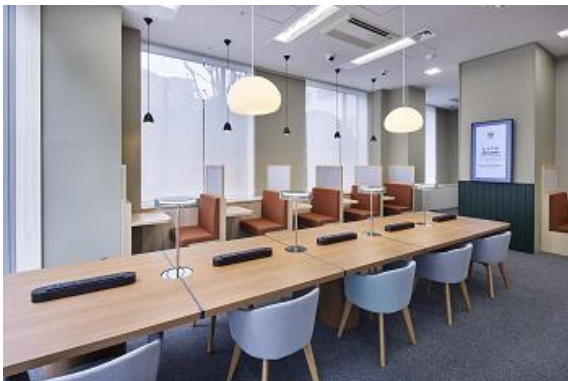
JustCo Zone 大宮 ホットデスク

今後「JustCo Zone」は、拠点の順次拡大により、都心部・郊外エリアを問わず「ユーザーがいつでもどこでも快適に仕事ができるフレキシブルなワークスペース環境」を提供します。