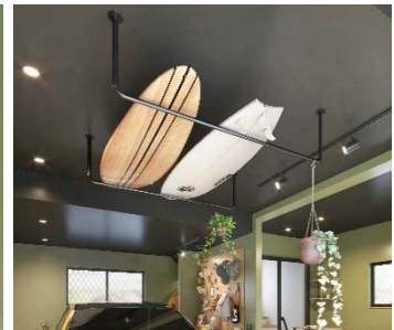
天井パイプ/ ライティングレール/ スポットライト