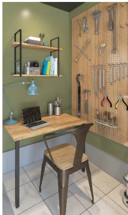
ラダーシェルフ/ デスクカウンター

ガレージ内には、ガレージライフを楽しむための便利なアイテムを標準採用しています。