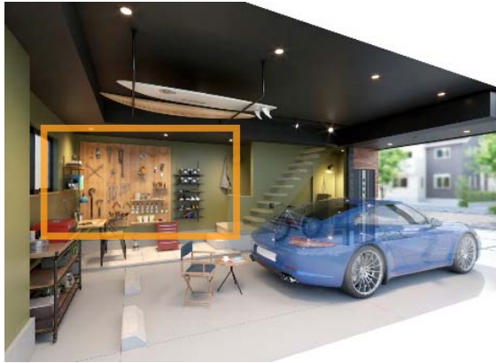
1階ガレージ(ワンルームタイプ)