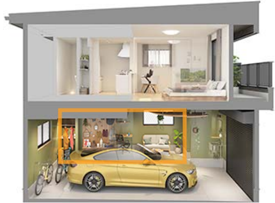
建物断面イメージ(1LDKタイプ)