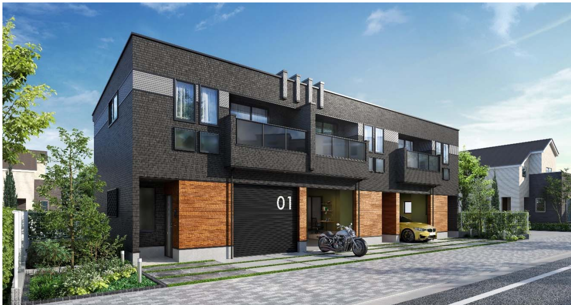
CIEL GARAGE 1LDK・3戸並びタイプ

※ 東京都・神奈川県・埼玉県・千葉県・愛知県・大阪府の一部地域での限定販売となります。