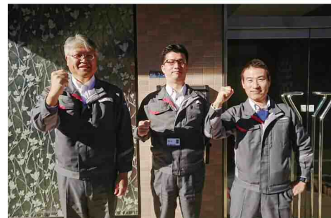
東大阪支店チームメンバー