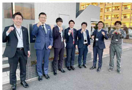
藤沢支店チームメンバー