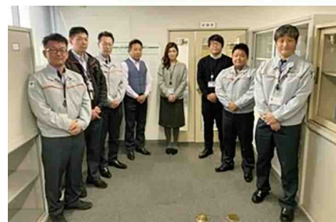
広島営業所チームメンバー