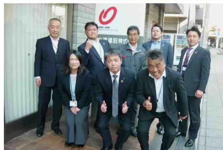
横浜南支店チームメンバー