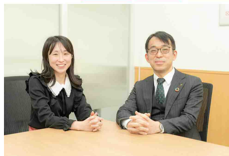
横浜青葉支店チームメンバー