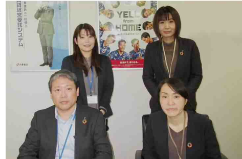
熊本北支店チームメンバー

※ 各施策の実施内容については、新型コロナウイルス感染症の状況により変更・中止となる場合があります