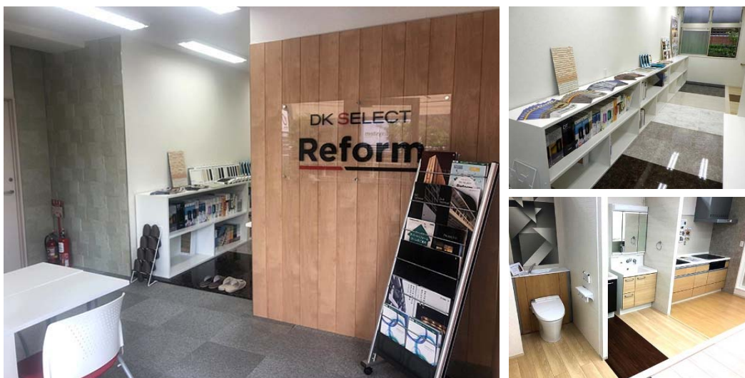
船橋支店のショールームの様子

そして、9月には、船橋支店(千葉県船橋市)にリフォーム・リノベーションに特化したショールームを開設し、床材や住宅設備の実物をご確認いただけるようにしています。