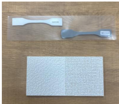
体験キット(上:シーリング、下:高耐久のクロス)