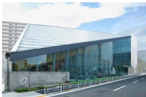
大きな三角形の屋根が特徴的な外観

※ Cross Laminated Timber(クロス・ラミネイティド・ティンバー)の略/JAS名称:直交集成材。板の層を各層で互いに直交するように積層接着することで強度を高めた厚型パネル。