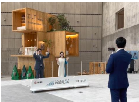
オンライン案内の様子

オンラインを通じて、ご案内スタッフがお客様と対話しながら施設の紹介や展示物の紹介をします。お客様には事前にクロスやシーリングの耐久性をご確認いただける体験キットを送付し、「見る」「聞く」だけでなく、展示している資材に実際に「触れる」といった体感もできるオンライン案内となっています。