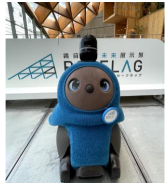
「ルーくん」に命名 ご来館いただいたお客様の投票 で名前が決定しました！