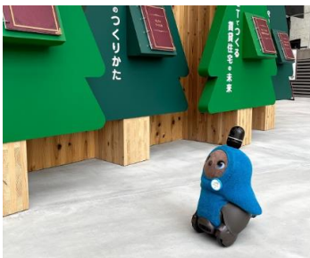
独自の技術を使い、館内の地図を覚えることができます。広い館内を一生懸命お勉強しています。