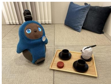
オーナーズモデルルームの茶室でほっと一息。休憩中のお客様と遊ぶのがお仕事です。