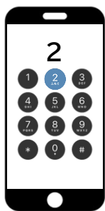
音声ガイダンスに従って「SMS送信(2番)」を選択