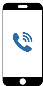
問い合わせ電話をかける