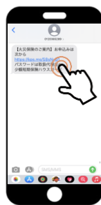
SMSを受信しURLをタップ