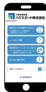
Webサイトが表示される