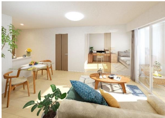
REVASA-K(多雪)内観イメージ 2階LDK