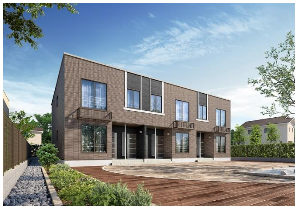
REVASA-K多雪 外観イメージ 3戸並び(全6戸)タイプ(南入り)

当社は今後も、地域のニーズに合わせた商品開発を通し、良質な賃貸住宅を提供していきます。