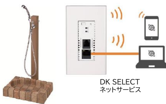
DK SELECT ネットサービス