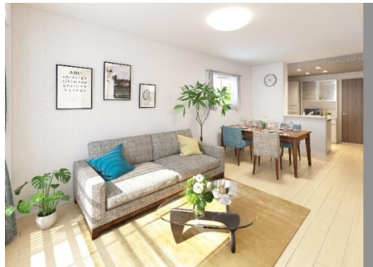
REVASA-K(北海道)内観イメージ 2階LDK