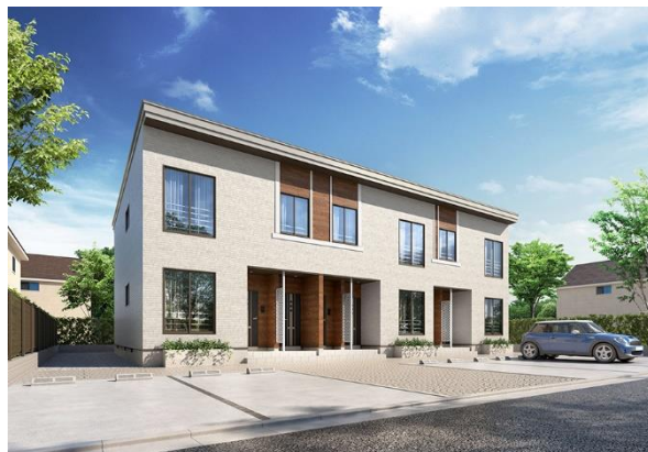
REVASA-K北海道 外観イメージ 3戸並び(全6戸)タイプ(南入り)