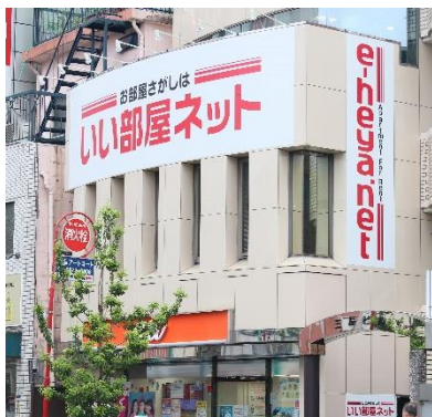
インターナショナル店外観