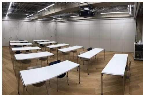
②セミナールーム 21名収容/65.4㎡/5,700円～