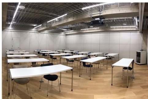
③セミナールーム 24名収容/74.4㎡/5,700円～