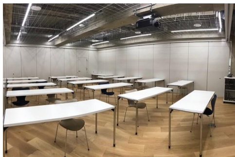
①セミナールーム 21名収容/64㎡/5,500円～