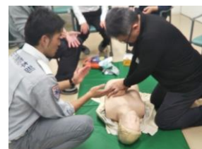
視覚障がいに配慮したAED講習