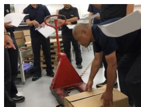
ハンドリフトの安全な使い方講習