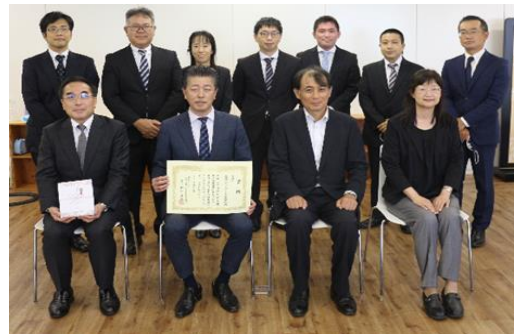
9月27日 表彰式 品川本社にて

「障害者雇用職場改善好事例」は、企業における障がい者の雇用と職域の拡大、及び職場定着の促進や、障がい者雇用に関する理解の向上を図る目的で行っています。今年度のテーマは「障害者の健康に配慮し安心・安全に働けるように取り組んだ職場改善好事例」で、障がい者雇用における雇用管理、雇用環境などに対し改善・工夫が行われた取組み事例が対象となっています。