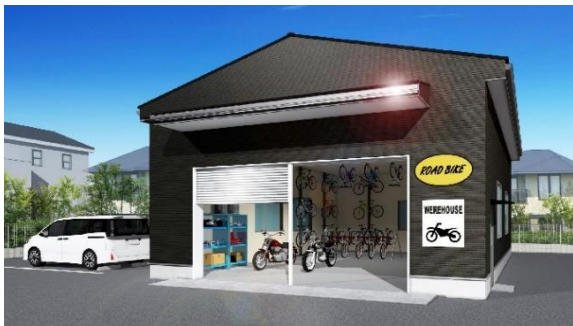
外観イメージDタイプ