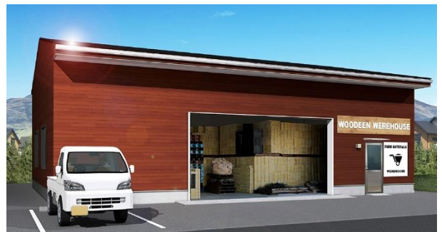
外観イメージEタイプ