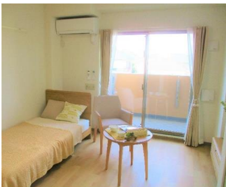
居室内(モデルルーム)の様子