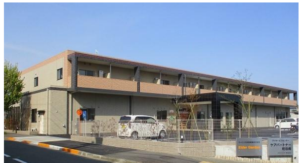
「エルダーガーデン南つくし野」外観

本住宅は、東急田園都市線「すずかけ台駅」から徒歩3分と駅から近く、近隣に公園もある緑豊かな環境です。一般的な賃貸住宅と同様の自立した暮らしが可能となるサービス付き高齢者向け住宅を開設し、高齢者が住み慣れた地域で安心して暮らせるまちづくりに貢献していきます。