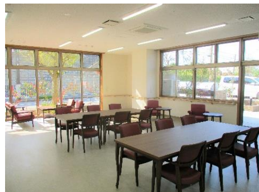
ラウンジスペース