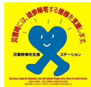
災害時帰宅支援ステーション ステッカー