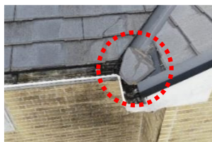
ドローンで発見した屋根の破損