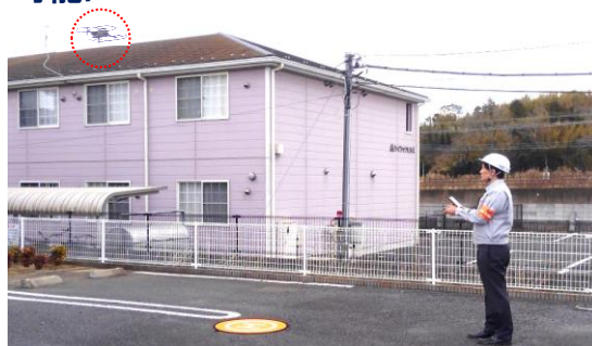
地上からドローン进行操作している様子

当社は、賃貸建物の完成後、2ヵ月に一度の頻度で建物の点検(以下、定期点検)を実施し、「建物定期報告書」としてまとめ、オーナー様へ郵送しています。定期点検は、適切なタイミングで適切なメンテナンスを行うことで、管理建物の耐久性向上と品質維持を図るためのものです。定期点検の際、外壁や雨どいの破損といった建物外周に足場を組む必要のある修繕箇所が見つかった場合は、その機会を利用し高所から屋根点検を実施していましたが、今後はいつでも点検することが可能となります。また、高所作業も不要となるため、点検作業の安全性が向上します。