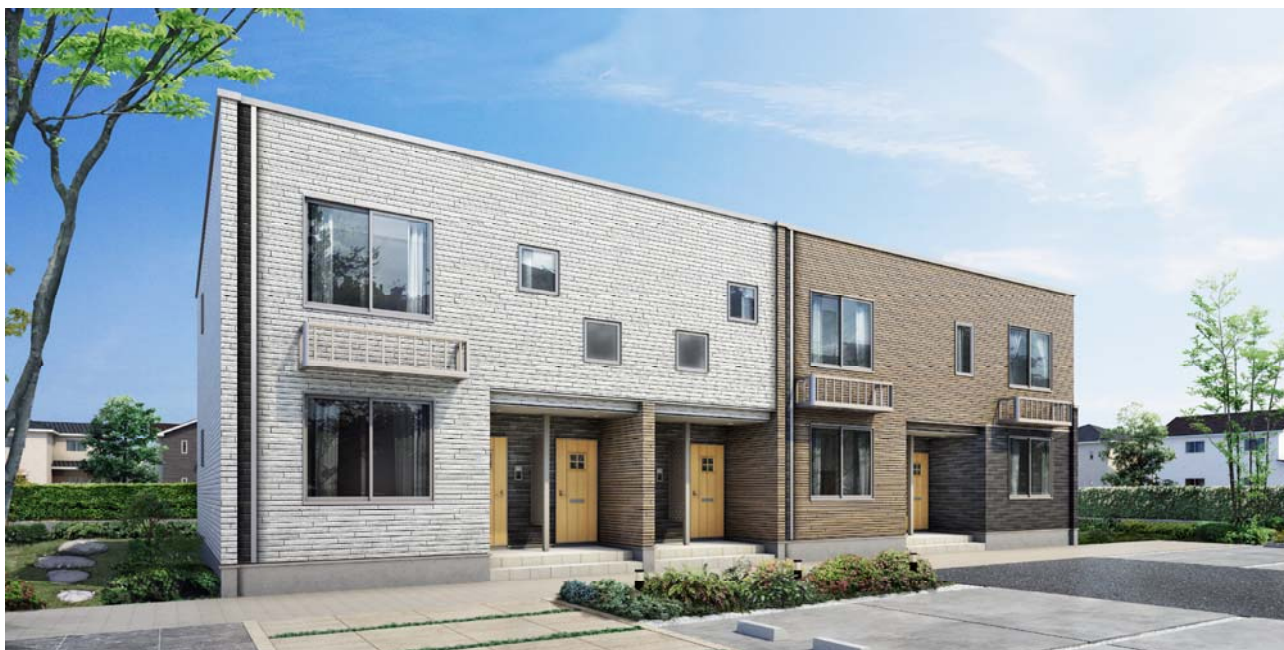
【外観イメージ】3戸並び6戸タイプ(南入り)

※2 共有の階段や廊下がなく、1階に面したそれぞれの独立した玄関から直接各戸へ入ることのできる集合住宅。