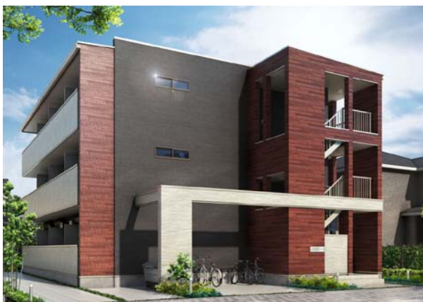
外観イメージ:4戸並び12戸タイプ

※2 共有の階段や廊下がなく、1階に面したそれぞれの独立した玄関から直接各住戸へ入ることのできる集合住宅。