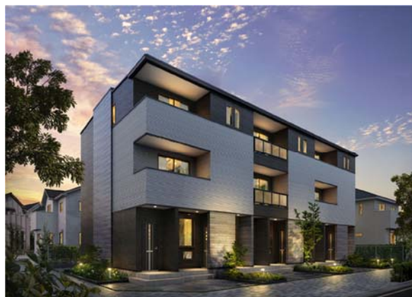
外観イメージ: 3戸並び9戸タイプ