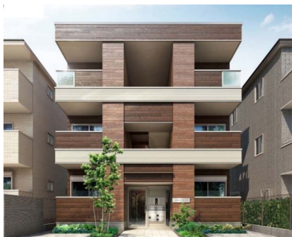
外観イメージ: 2戸並び6戸タイプ