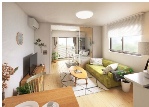
内観イメージ:リビングダイニング