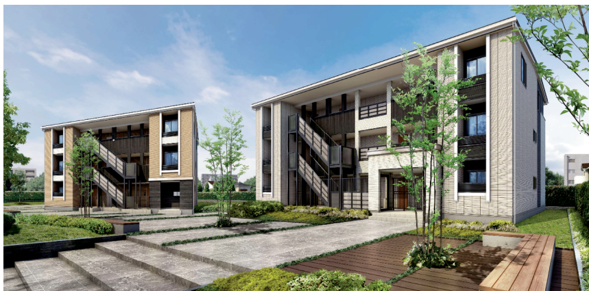
外観イメージ:左・3戸並び9戸タイプ(桁入り)、右・4戸並び12戸タイプ(桁入り)