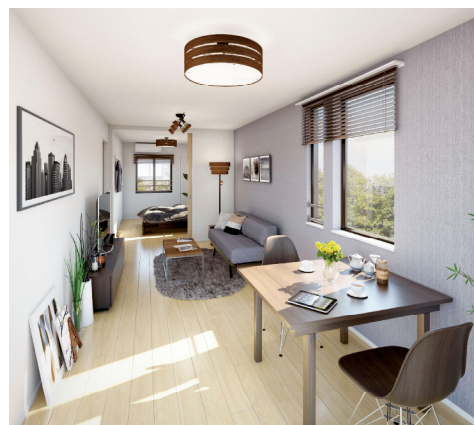
内観イメージ:3F、リビングダイニング