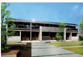
ルタンソレイユ外観イメージ

災害時、地域の方も電源が使える太陽光パネルを備えた賃貸住宅「SOLEIL(ソレイユ)」を販売開始。また、建物の建築中にも現場の仮囲い※に避難所や防災マップを掲載し、地域の方々への防災意識向上も促進しています。