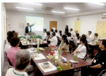
ワークショップの様子 (2018年7月21日・仙台南支店)

全国各地で“地域のコミュニケーション活性化”を目指し、オーナー様や入居者様、地域の方、従業員が参加し、「防災への向き合い方」を学ぶワークショップを実施しています。