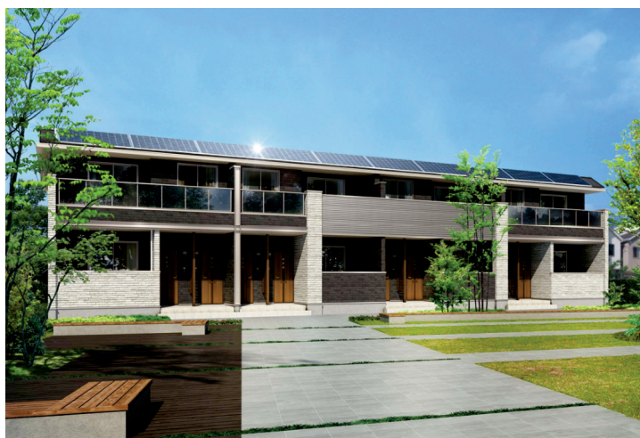
ルタンソレイユ外観イメージ/4戸並びタイプ

※2 サービス適用には、Loopとの「売電契約(オーナー様)」「電力契約(入居者様)」が必要です。