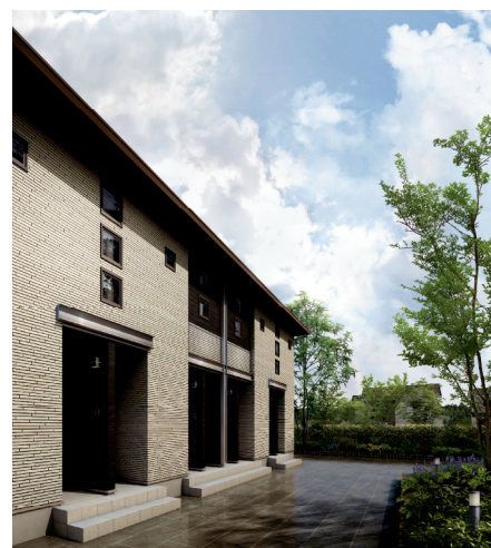
ラシックソレイユ外観イメージ/4戸並びタイプ