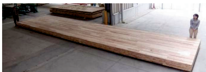
【大屋根構造に用いるCLT】