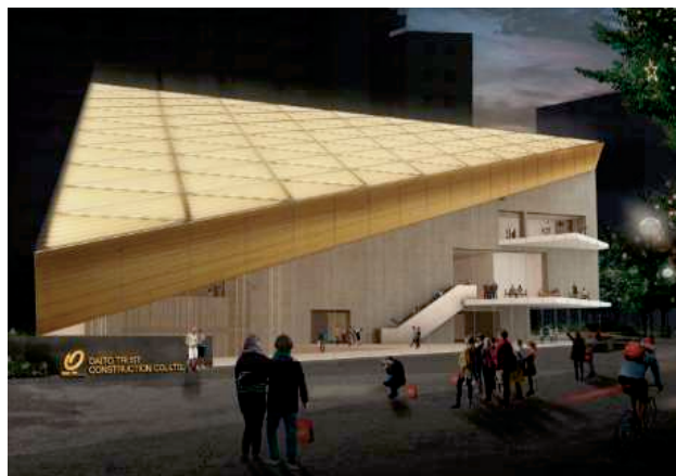
【外観イメージ(北側)】