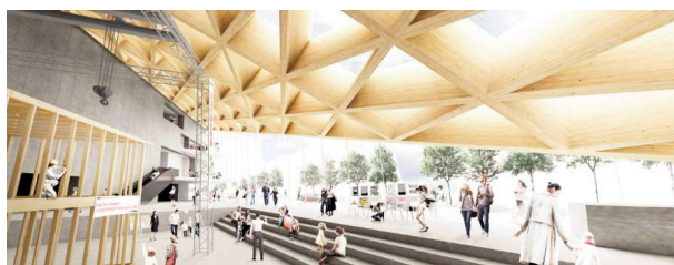
【エントランスアトリウム】

一般的によく知られている集成材が、張り合わせる板の繊維方向を並行方向に張り合わせるのに対し、CLTは、板の層を各層で互いに直交するように積層接着することで強度を高めた厚型パネル。