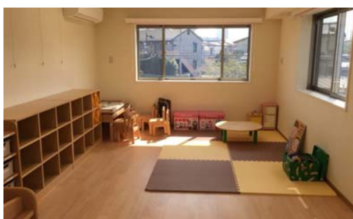
キッズパートナー小机 室内