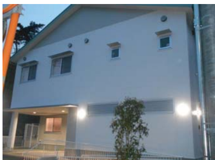
キッズパートナー東戸塚外観