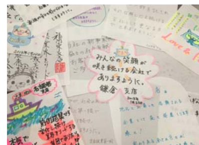
【グループ社員による未来へのメッセージ例】

今回植樹する「はるか」は、20年後には立派な成木となります。植樹式の開催にあたり、「はるか」が成木となる20年後の大東建託グループに対する希望や期待を込めた未来へのメッセージを社員に募りました。メッセージを記入する用紙は水溶性で、植樹の際に苗木とともに地中へ埋める予定です。