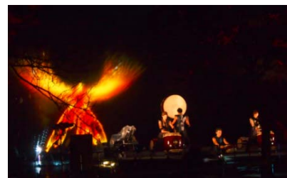
【地元太鼓グループによる演奏】