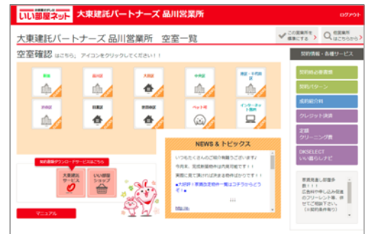
「不動産会社様マイページ」トップ画面イメージ

本システムは、約13,000店の協力不動産会社様の業務効率および利便性向上を目的に提供しており、当社グループが管理する賃貸建物への、入居者様紹介にご協力いただく不動産会社様に対し本システムを提供することで、協業体制を一層強化し、引き続き高い入居率の維持を目指します。