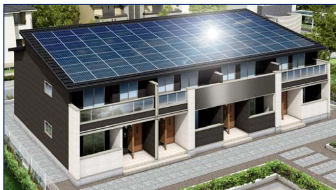
【イメージ図 ZEH基準を満たす賃貸集合住宅】