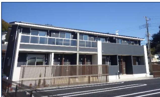
【ZEH基準を満たす賃貸集合住宅第1号】

ZEHとは、年間の1次エネルギー消費量がネットゼロとなる(ネット・ゼロ・エネルギー)住宅(ハウス)のことで、日本のエネルギー需給の抜本的改善の切り札となるなど、きわめて社会的便益が高いものとして、経済産業省、国土交通省、環境省が連携事業として取り組みを進めています。大東建託と京セラは、低圧一括受電システムを組み合わせたZEH基準を満たす賃貸集合住宅を積極的に展開することで、建物価値の向上、快適な住空間の実現、光熱費の削減、環境負荷の低減に寄与することを目指しています。