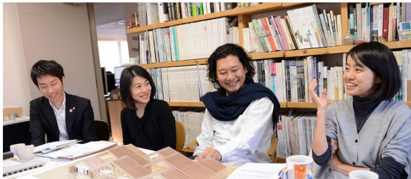
【ディスカッション風景】