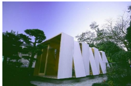
XXXX/ 焼津の陶芸小屋 写真：MOUNT FUJI ARCHITECTS STUDIO