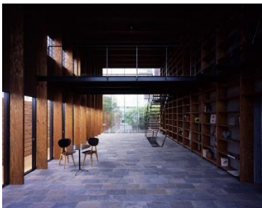
M3・KG/ 大きな家