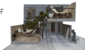
【 Prototype 02 の模型写真】

< 本件に関するお問い合わせ > 大東建託株式会社 経営企画室 三輪・和賀 TEL:03-6718-9174