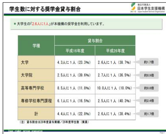
資料① 「奨学金増加の背景、奨学金貸与割合(2016年)」