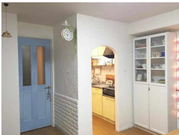
【最優秀賞】: シャビーシックなフレンチインテリア