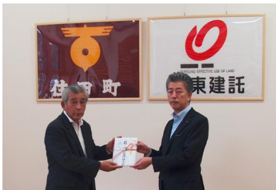
【住田町での寄付金受領式】