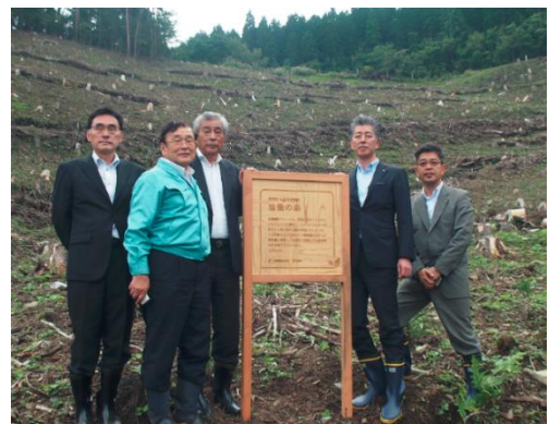
【「住田町・大東建託 協働の森」の看板を設置】

<本件に関するお問い合わせ> 大東建託株式会社 経営企画室 畑中・和賀 E-MAIL: he072032@kentak.co.jp TEL: 03-6718-9174