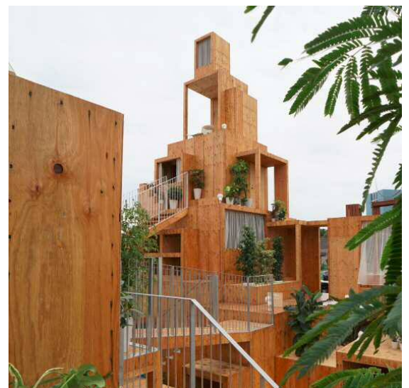
『賃貸空間タワー』現場風景