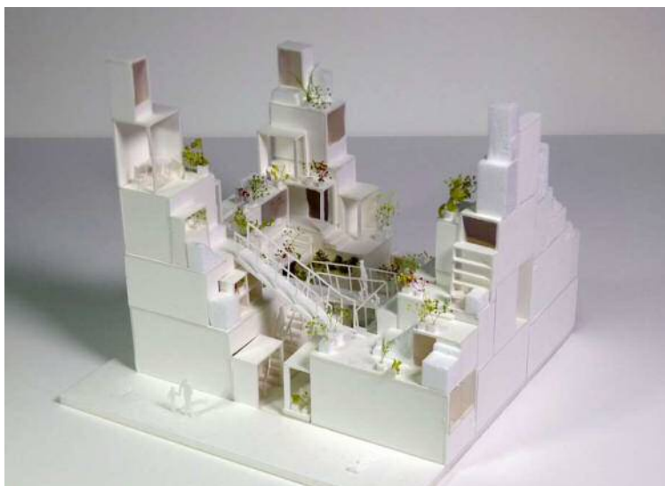
『賃貸空間タワー』イメージ模型

大東建託株式会社（本社：東京都港区、代表取締役社長：熊切直美）は、7月30日（土）よりお台場で開催される HOUSE VISION2 2016 TOKYO EXHIBITION に出展します。会場では、建築家・藤本壮介氏とのコラボレーションによる「賃貸住宅の再定義」をテーマにした賃貸住宅『賃貸空間タワー』を展示します。会期中は実際に『賃貸空間タワー』に入り、その空間を体感していただくことが可能です。また、一般公開初日である7月30日（土）には、13時より建築家・藤本壮介氏のトークイベントも開催されます。