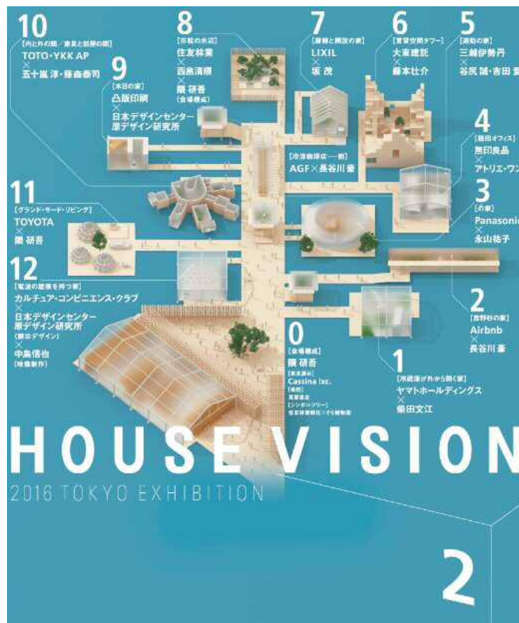
HOUSE VISION2 2016 TOKYO EXHIBITION キービジュアル

<本件に関するお問い合わせ> 大東建託株式会社 経営企画室 畑中・和賀 E-MAIL: he072032@kentakudo.co.jp TEL: 03-6718-9174