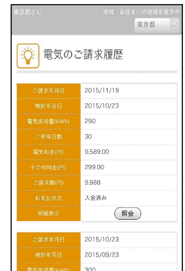
電気請求履歴 イメージ