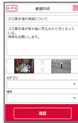
写真とメッセージを投稿

また、アプリ上で管理会社とやり取りすることができるようになり、電話だけでは伝わりにくい相談も写真を添付することでより正確に伝えることができます。