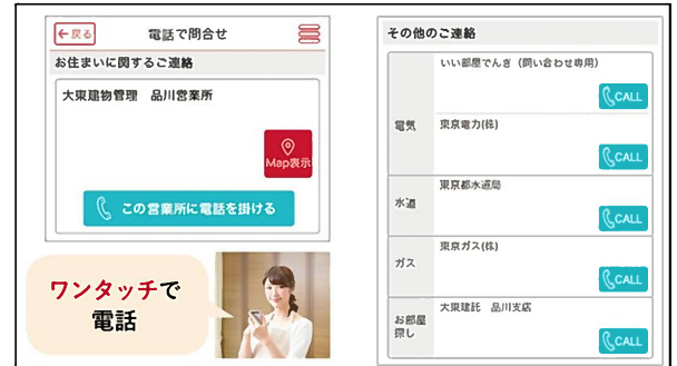
問い合わせ画面 イメージ

お住まいの建物を管轄する管理会社をはじめ、水道・ガス・電気など、各種窓口の連絡先を一括登録。この画面から、直接電話の発信が可能です。いざという時、連絡先が見つからずに慌てることがなくなります。