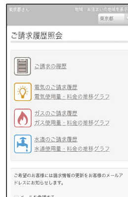
請求一覧 イメージ