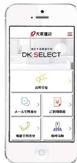
【「DK SELECT 進化する暮らしアプリ」のTOP画面】