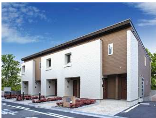
●アシェイド・ライン 外観

アシェイド・ラインは従来の木造アパートのイメージを一新するシンプルでスッキリとしたデザインと床遮音性能や省エネ性能の高い点やライフサイクルコストの低減など、賃貸住宅として大切な問題を解決している点が高く評価されました。