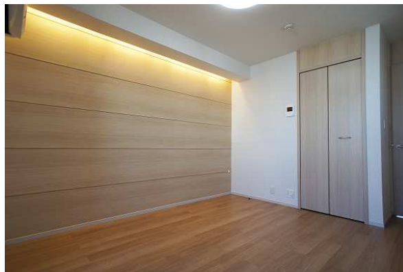
●アシェイド・ライン 内観