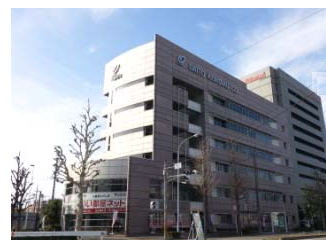
大東建託 名古屋支店

http://www.daito-areatop.com/ （← 全国の大東建託検索画面）