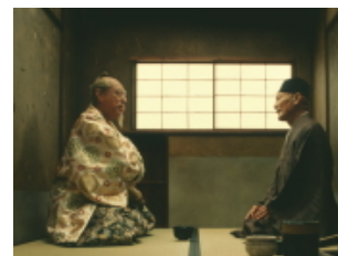
3作目「秀吉と利休篇」