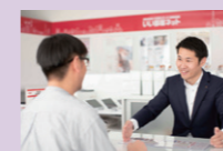
入居者募集・斡旋