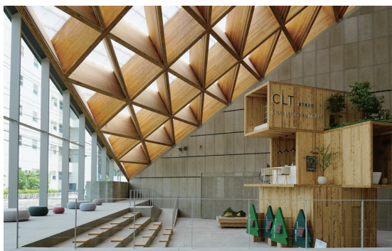
ROOFLAG (ルーフラッグ) 賃貸住宅未来展示場 (東京都江東区)