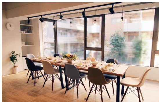
.room(ドットルーム) (東京都品川区)