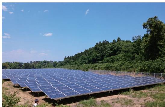
大和茨城第二発電所 (茨城県銚田市)