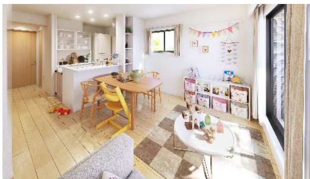
内観イメージ(間取り:2階2LDK+S) ※調度品・小物・チャイルドフェンスは含まれません

キッチンを中心とした間取りになっており、リビングから洋室までを見渡すことができるため、小さなお子様を見守りながら安心して料理することが可能です。