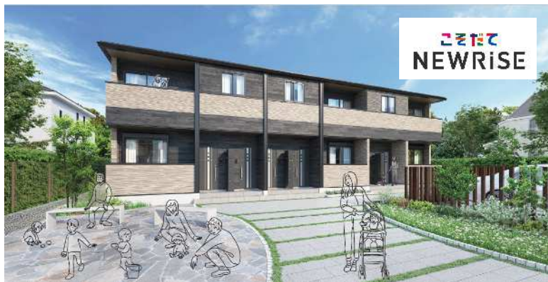
外観イメージ(プラン:玄関南側の3戸並び、外壁:モダンベージュ、オプション:宅配ボックス)