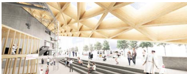
【エントランスアトリウム】

一般的によく知られている集成材が、張り合わせる板の繊維方向を並行方向に張り合わせるのに対し、CLTは、板の層を各層で互いに直交するように積層接着することで強度を高めた厚型パネル。