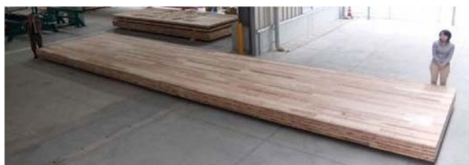
【大屋根構造に用いるCLT】