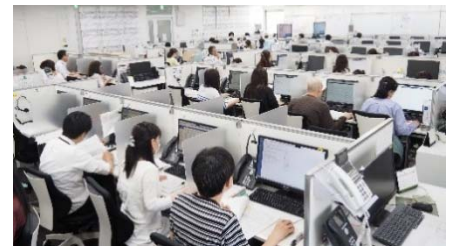
24時間いい部屋サポートセンターの東京センター

「24時間いい部屋サポートセンター」は東京・福岡に拠点を置き、管理営業所の営業時間外に、お部屋探しや入居者様からのお問い合わせなどを受け付け、月3万件以上のお問い合わせに対応しているコールセンターです。2016年9月からは、外国人入居者様の増加など多様化するニーズに対応するため、英語・中国語・韓国語・スペイン語・ポルトガル語に対応できるスタッフが常駐しています。