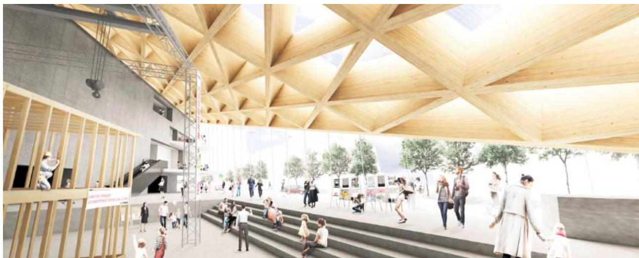
【エントランスイメージ】 CLTを使用したファサードが特徴的なエントランスは、情報発信機能を兼ね備えた吹き抜けの開放的な空間(アトリウム)