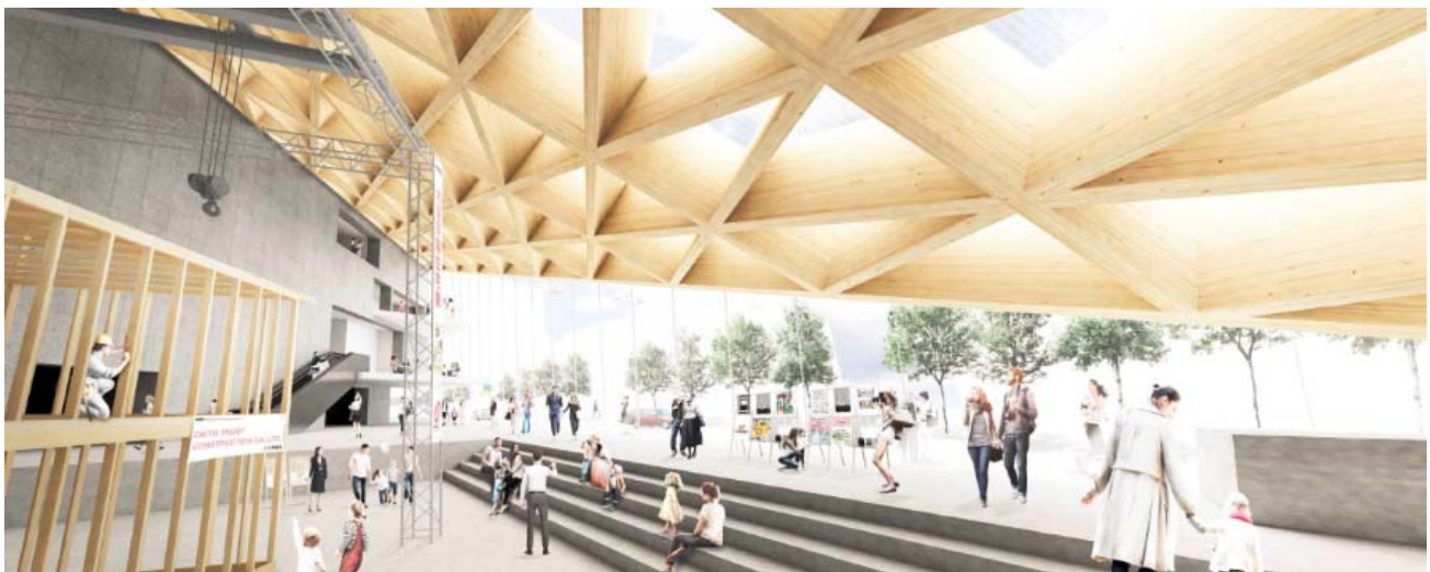
【エントランスイメージ】 CLTを使用したファサードが特徴的なエントランスは、情報発信機能を兼ね備えた吹き抜けの開放的な空間(アトリウム)